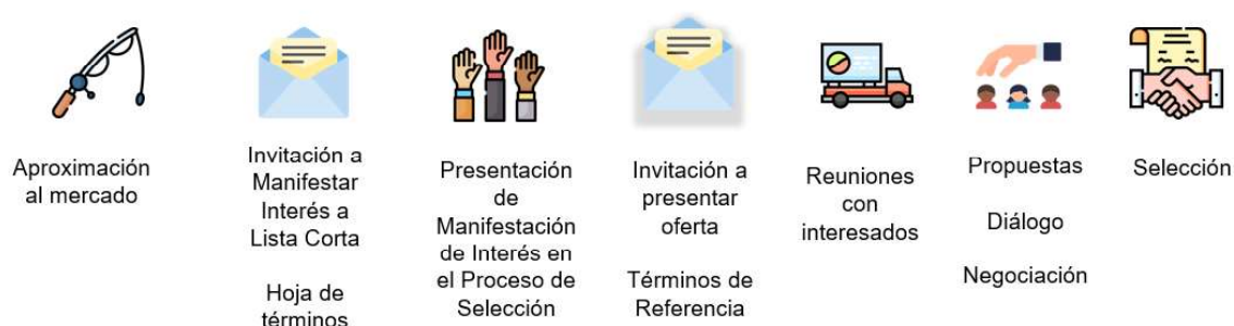
Figura 2. Esquema general del proceso de vinculación

Durante el Proceso de Vinculación, el relacionamiento con el mercado tiene lugar a través de las presentaciones y reuniones uno a uno con los interesados, el desarrollo de la Fase de Diálogo y egociación con los oferentes precalificados, así como de la definición y cierre de los documentos del Proceso de Vinculación con el oferente seleccionado como Socio Estratégico; todo ello, de acuerdo con las reglas previstas en el Reglamento del Proceso de Vinculación y en el Reglamento para el relacionamiento con el mercado.